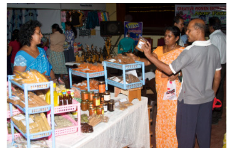
Die Ideen unserer Kreditnehmerinnen waren fast grenzenlos

Nach Abschluss des dreitägigen Marktes gab es überall zufriedene Gesichter, die Gesichter der Organisatoren, die glücklich darüber waren, dass alles reibungslos verlief, die Gesichter der Besucher, die günstig und gut einkaufen konnten, sowie die Gesichter der Unternehmerinnen, die nicht nur gute Umsätze verzeichnen können, sondern auch viele neue Freundinnen gefunden hatten.