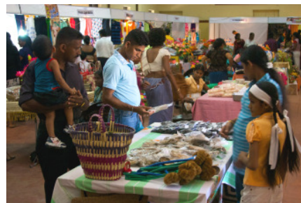
Die Besucher waren sehr interessiert und kaufbereit

Frauen in bunten Saris und Männer in ihrer typischen Bürottracht bestehend aus einem weißen Hemd und einer schwarzen Hose schlendern von einem Stand zum anderen. Immer mehr Besucher werden zu Kunden und tragen ihre Einkäufe aus der Halle, während die Verkäufer bereits im nächsten Kundengespräch stecken.