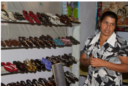
Verkauf der eigenen Schuhproduktion

Galle im Frühjahr 2011, der Verkehr bahnt sich hupend seinen dreckigen Weg entlang der Küstenstraße A2, der berühmt berüchtigten Galle Road. Überall sieht man abgerissene Gebäudeteile, die der Verbreiterung der Hauptstraße zum Opfer gefallen sind. In Mitten des Staubs und des Lärms wirkt der Vorplatz des Rathauses fast schon wie eine Oase der Ruhe.