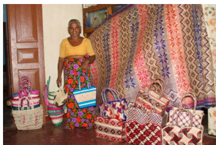
Alles selbst entworfen und geflochten